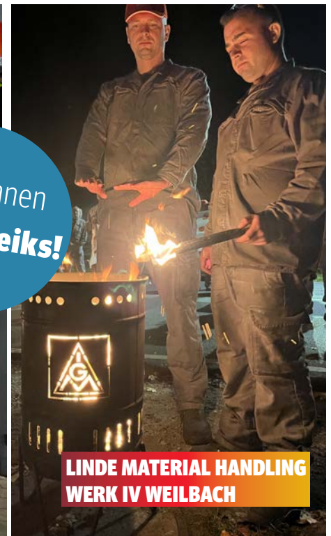
LINDE MATERIAL HANDLING WERK IV WEILBACH