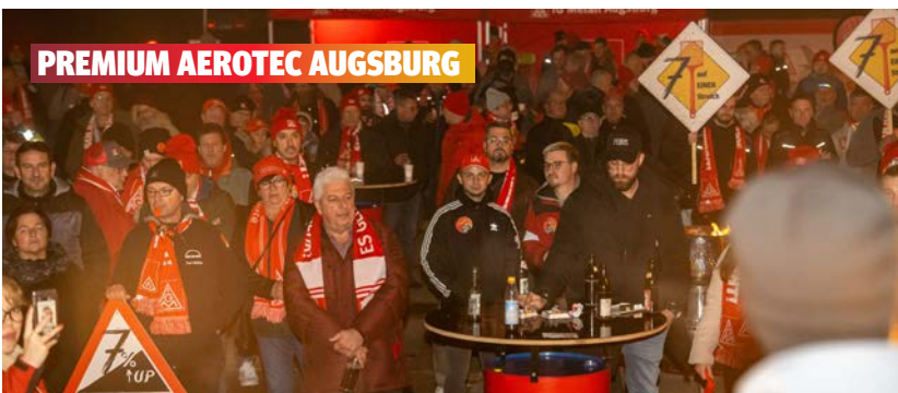
PREMIUM AEROTEC AUGSBURG