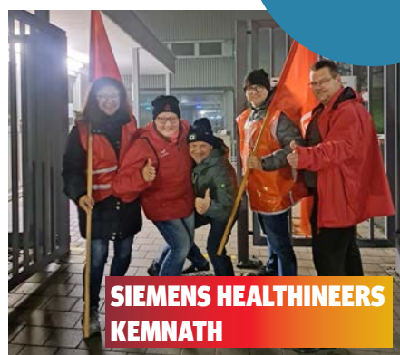
SIEMENS HEALTHINEERS KENNATH