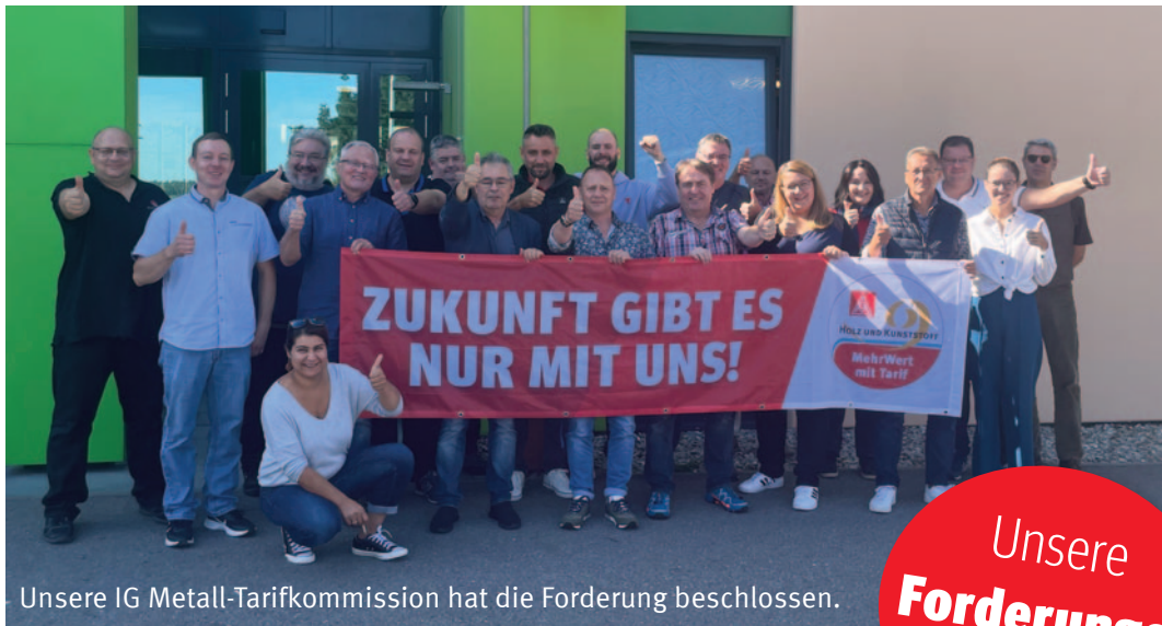
Unsere IG Metall-Tarifkommission hat die Forderung beschlossen.

Es ist wieder höchste Zeit für mehr Geld und mehr Wertschätzung . Unsere Chance darauf kommt jetzt: Die Tarifrunde für die holz- und kunststoffverarbeitende Industrie startet!