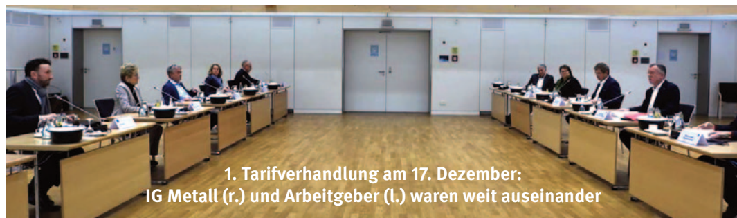
1. Tarifverhandlung am 17. Dezember: IG Metall (r.) und Arbeitgeber (l.) waren weit auseinander

Die IG Metall fordert für Unter- nehmen mit Problemen, die Arbeitszeit abzusenken und damit Beschäftigung zu si- chern. Dafür muss es einen Teillohnausgleich geben. So teilen sich Beschäftigte und Arbeitgeber die Kosten. Und die Unternehmen behal- ten die Fachkräfte an Bord, wenn es wieder auf- wärts geht!