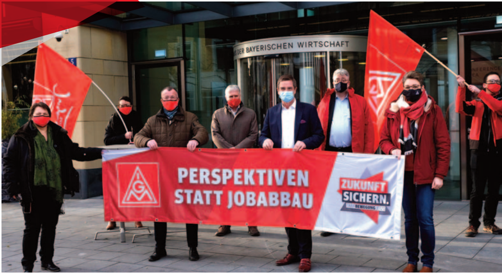
Die IG Metall-Verhandlungskommission vor dem Haus der bayerischen Wirtschaft

V.i.S.d.P.: IG Metall Bayern, Johann Horn, Werinherstr. 79, Geb. 32a, 81541 München; Druck: Dierichs Kassel